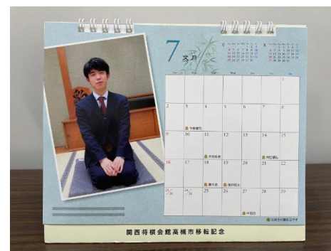
棋士の写真入り卓上カレンダー