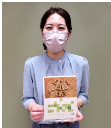
里見香奈女流五冠