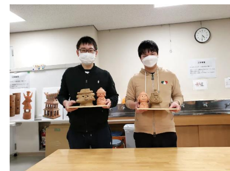
はにわづくり体験イベント