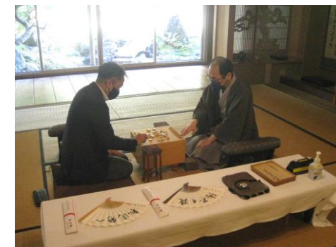
タイトル戦疑似体験イベント