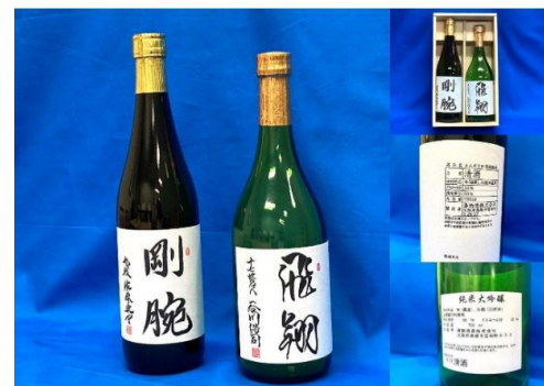
棋士の揮毫入りお酒セット