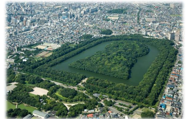
仁徳天皇陵古墳（堺市）