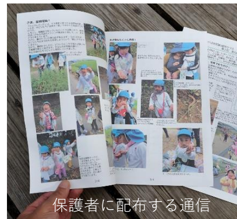
保護者に配布する通信