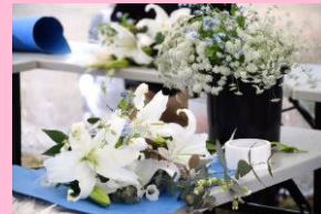
長浜はユリ栽培が盛ん。