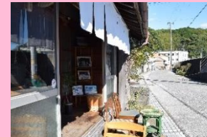
港町の風情が残る。