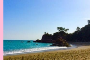
年間約70万人来訪の桂浜。