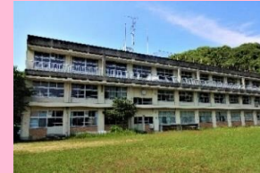
閉校した旧御豊瀬小学校。