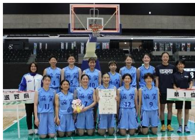
栃木国体バスケットボール 成年女子（優勝）