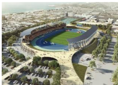
陸上競技場完成イメージ