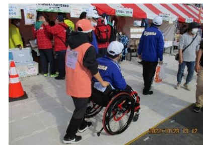
栃木障スポ 選手団サポートボランティア