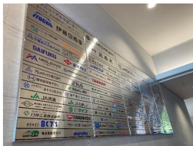
銘板例（琵琶湖博物館）